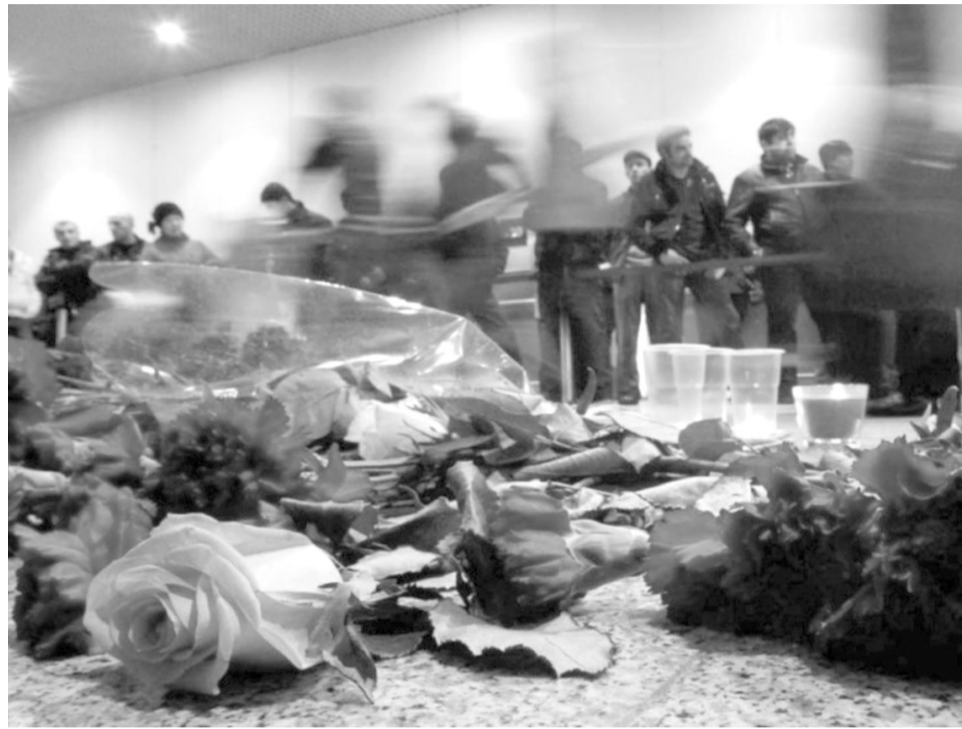
Уважаемые Волжане! При получении информации об угрозе террористического акта обезопасьте свое жилище

Управление по делам ГО и ЧС администрации городского округа – г. Волжский