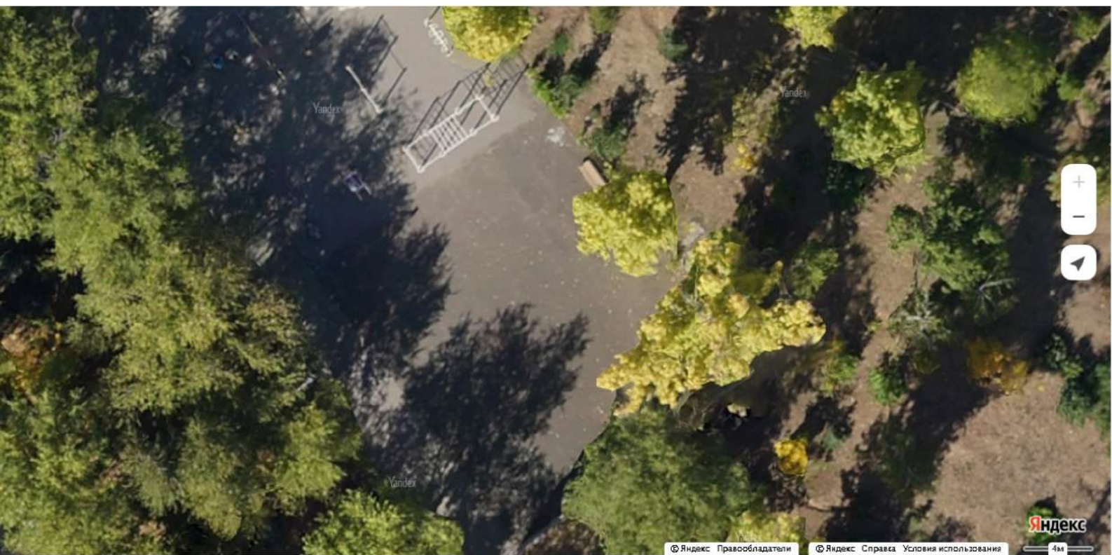
Фото - Состояние объекта «До»